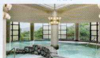
伊豆マリオットホテル修善寺