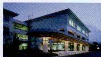
ラフォーレ修善寺