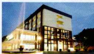
ホテルファイナリーヒル

1泊2日ドックは病院施設内でなく、提携している施設に宿泊していただき、ゆったりとお身体の点検をしたい方におすすめです。