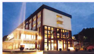
ホテルワイナリーヒル

1泊2日ドックは病院施設内でなく、提携している旅館やホテルに宿泊していただき、ゆったりとお身体の点検をしたい方におすすめです。