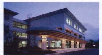
ラフォーレ修善寺