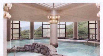
伊豆マリオットホテル修善寺