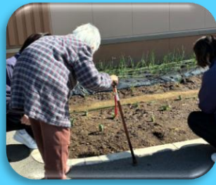
元気に育ちますように！