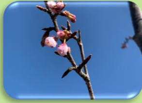
桜の開花はすぐそこ

春の足音聞えました？ 「はーるよこい」から始まる歌がありますが、二月は本当に寒さが厳しいものでしたね。 リハッピーの玄関前の風通りも強く、身体の芯から冷えるような寒さを感じる日々が続きました。そんな中でも、待ち焦がれる春、恋焦がれる春が、もうすぐやってきます。 「はるよこい」 その「こい」は、「来い」ですか？それとも「恋」ですか？ 私は「春よ恋」でも可愛いなと思ったら、なんと、小麦粉の名称で既にあるそうです。 待ち遠しい春の穏やかな暖かさ。待っていてねと、屋外庭園の桜の木が教えてくれました。 「はあるよこい 笑」